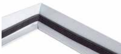
I chiusini Lock sono provvisti di guarnizione perimetrale sul telaio.